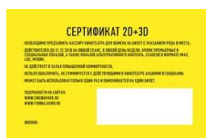
Рис. 10 Сертификат в кино

7.2. Количество Подарков в составе Призового Фонда ограничено. Подарки получают только первые 1 080 (Одна тысяча восемьдесят) Участников, обратившихся к Промоутеру в Местах проведения Акции согласно п. 5.2 настоящих Правил, определенных в соответствии с условиями и порядком, установленными настоящими Правилами.