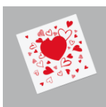
Рис. 1 Открытка

Подарок 3й категории – разветвитель для наушников в виде сердца и поздравительная открытка от Raffaello.