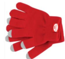
Рис. 3 Перчатки

Подарок 1й категории - 2 (два) сертификата в кино и поздравительная открытка от Raffaello.