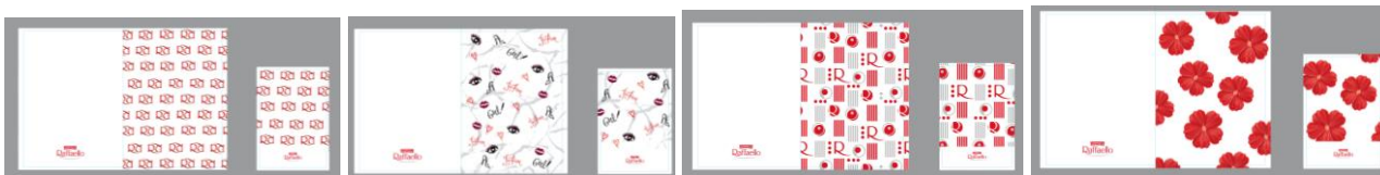
Рис. 5 Набор, состоящий из обложки для паспорта и обложки для пластиковой карты (4 вида дизайна)

Подарок 1й категории - сертификат номиналом 500 (Пятьсот) рублей в сеть магазинов «Золотое яблоко».