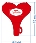
Рис. 2 Разветвитель для наушников

Подарок 2й категории – перчатки красные для сенсорной панели (с добавлением металлизированной нити на трех пальцах) и поздравительная открытка от Raffaello.