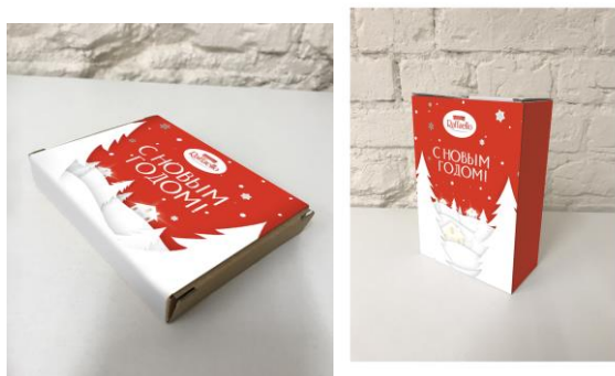
Рис. 4 Переносное зарядное устройство, набор бокалов

Подарок 2й категории выдается Участнику при предъявлении чека на покупку продукции Raffaello на сумму более 1 500,00 (Одна тысяча пятьсот рублей 00 копеек) рублей.