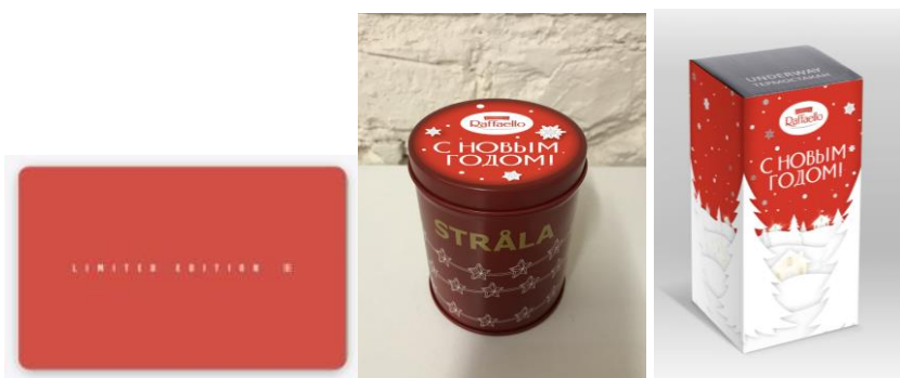
Рис. 3 Сертификат, гирлянда термостакан

Подарок 3й категории выдается Участнику при предъявлении чека на покупку продукции Raffaello на сумму более 700,00 (Семьсот рублей 00 копеек) рублей.